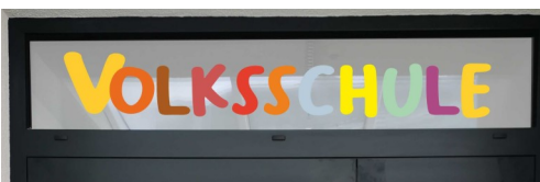
Die neue Beschriftung der Volksschule

Nach der Generalsanierung des Turnsaals kann dieser seit Oktober 2021 auch von Vereinen und Gruppen wieder für diverse sportliche Aktivitäten genutzt werden.